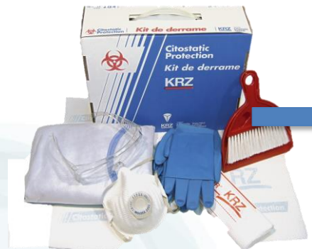
Kit de derrame