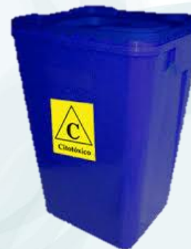
Contenedor residuos citotóxicos