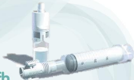
Sistemas cerrados transferencia de medicamentos