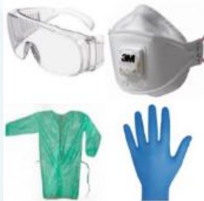
Equipos protección individual (EPI)