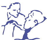
Sociedad Española de Cuidados Paliativos