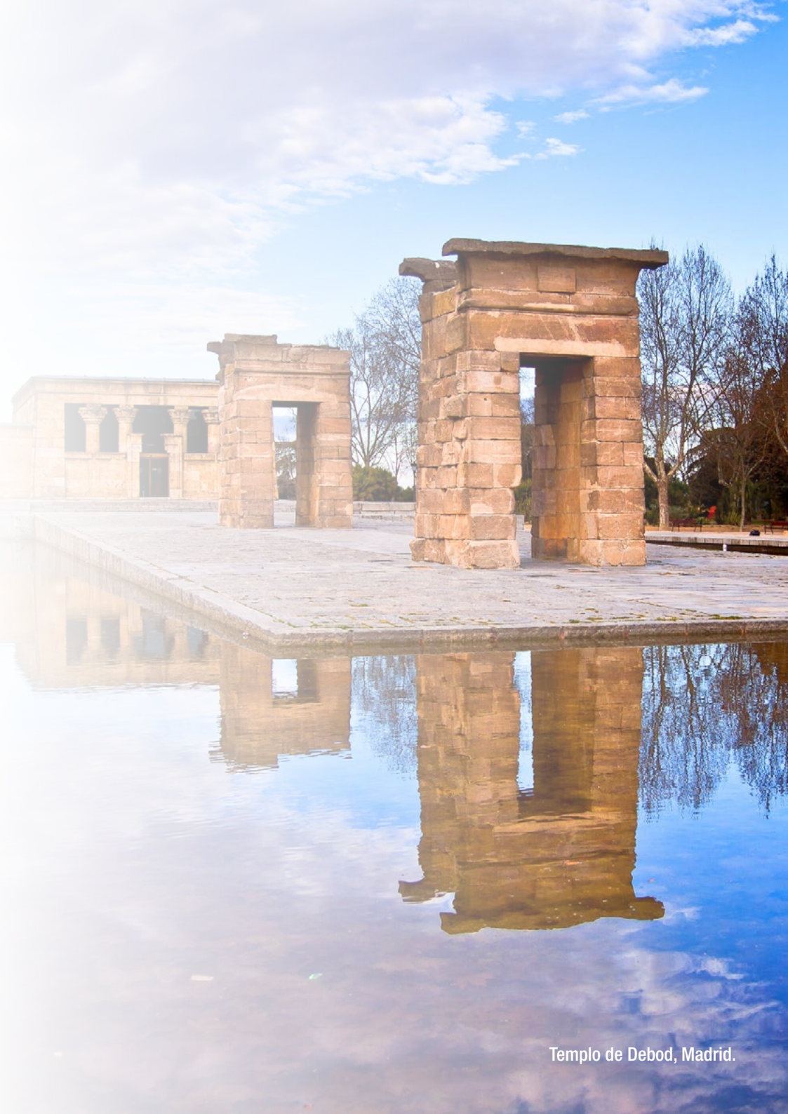
Templo de Debod, Madrid.